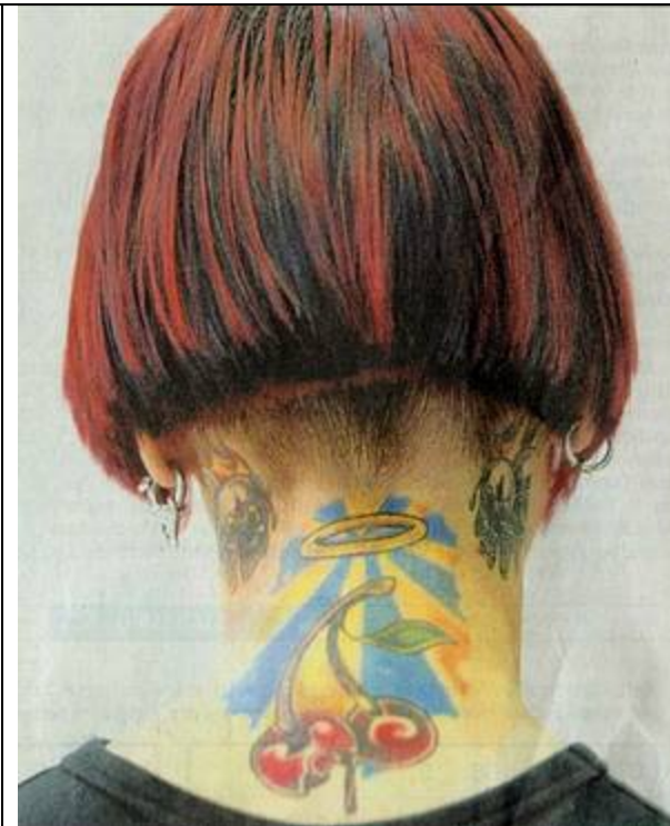
Früher waren Tattoos der Schmuck von Häftlingen. Längst sind die dauerhaften Körperbilder ein Massentrend.

Das bedeutet: Alle Piercings und Ohringe müssen rausgemacht werden. Bislang konnten Piercings (gerade auch im Gesicht) abgeklebt werden. Die Schulen konnten bisher selbst entscheiden, wie sie mit Schmuck im Sportunterricht verfahren, erklärt Ministeriumssprecherin Annett Pabst. Es gab deshalb auch die Möglichkeit des Überklebens mit Pflaster. Es habe sich jedoch herausgestellt, dass dies keine zuverlässige Lösung darstelle, da die Pflaster oft abgingen. Gerichte hätten solche Anordnungen bereits bestätigt. „Es gibt Urteile, bei denen die Sicherheit der Schüler höhere Priorität hat, als das Persönlichkeitsrecht auf das Tragen von Schmuck“, so Pabst. Um das Gesundheitsrisiko beim Tätowieren und Piercen gering zu halten, empfiehlt das Landesgesundheitsamt in Baden-Württemberg auf einige Punkte zu achten. Piercer und Tätowierer sollten Handschuhe tragen. Die Räumlichkeiten müssen von anderen Arbeitsbereichen getrennt sein. Piercing Schmuck aus Gold, Titan oder Platin mindere das Risiko von Allergien. Die Jugendlichen sollten eine Pflegeanleitung erhalten.